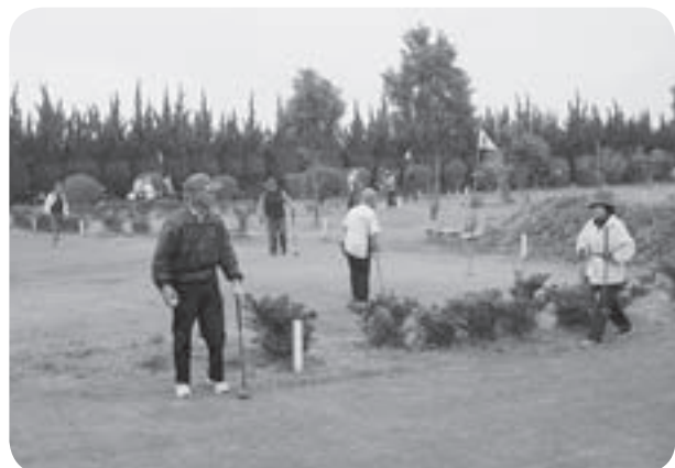
(歳末事業 ふれあいパークゴルフ)