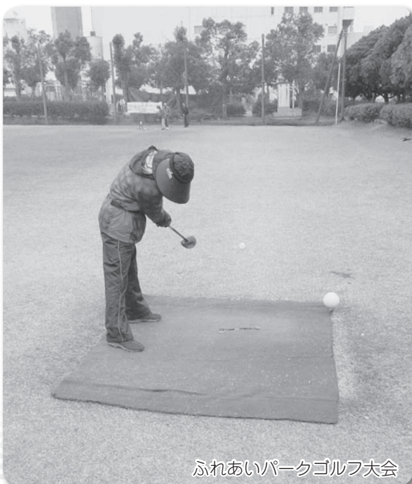
ふれあいパークゴルフ大会