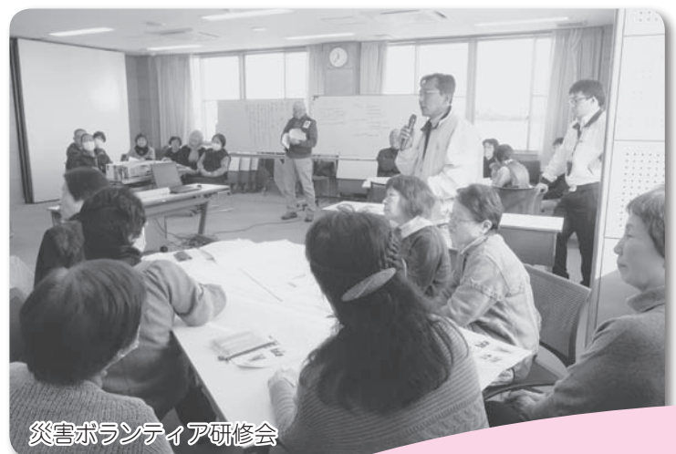
災害ボランティア研修会