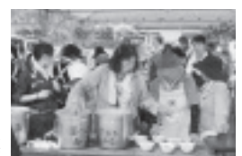
▲炊き出し訓練の様子