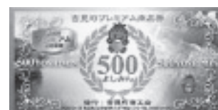
▲吉見町地域通貨商品券

支援に対して、1時間につき「吉見町地域通貨500円(共通商品券)」の謝礼をお渡しします。