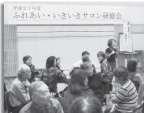
▲ふれあい・いきいきサロン研修会