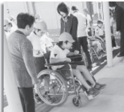
▲小学校福祉教育「車イス体験」