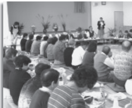
▲赤十字奉仕団「一人暮らし会食会」