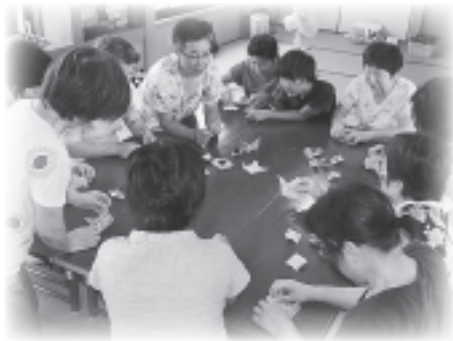
▲ふれあい・いきいきサロンより