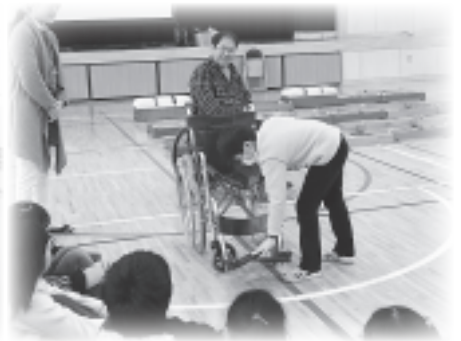
▲小学校福祉教育より