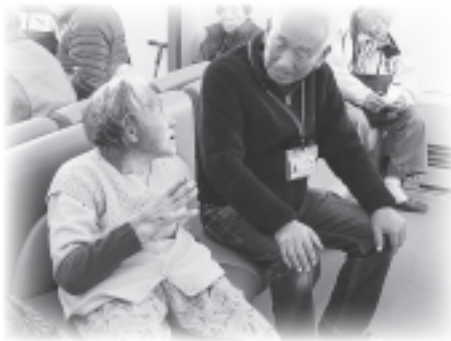
▲ささえあいサービスより