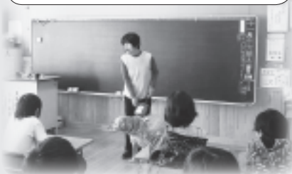
目が見えない、そしてできること 盲導犬のお仕事は？