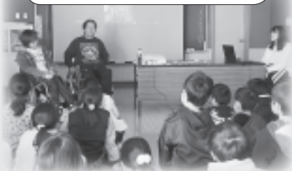
車いすの生活を知る 「障害者駐車場」の意味は？