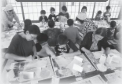
三世代で楽しく交流