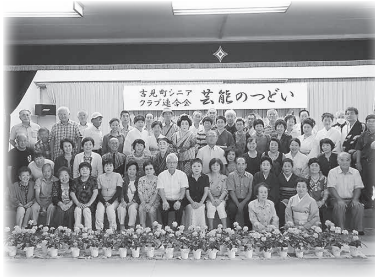
歌や舞踊など熱演を披露した芸能のつどい