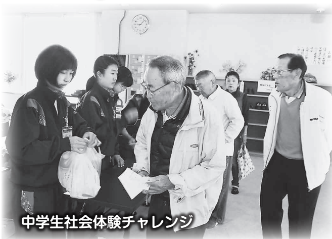
中学生社会体験チャレンジ