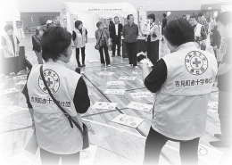
▲防災かるたの様子