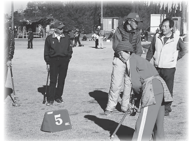
寒冷の早朝から元気はつらつグラウンドゴルフ大会