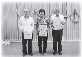
第2回輪投げ大会表彰にて