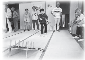
公式ルールで大盛況の輪投げ大会

明るい長寿社会の実現を目指して、地域の活性化を図っていき、会員の皆様に参加してみたいと思っただけのような企画を行ってまいりますので、大勢のご参会をお待ちしております。