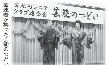
芸連者が集った芸能のつどい