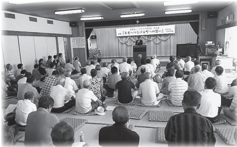
宮崎町長から未来へつなげる町への思いを聴講し、クラブ相互の意見交換をした交流会

高齢者の生きがい・健康づくりは、日頃から好奇心を持ち社会性をもつことが重要です。先ずは入会し、住み慣れた地域で、いつまでも元気に現役を維持できるよう、生涯学習に努め、地域社会での交流の輪を広げ、仲間たちと互いに支えあいながら活動してみませんか。