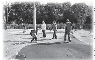
親交を深めた会員研修