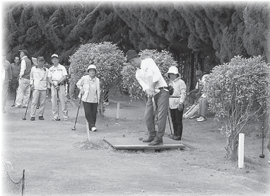
日頃の練習の成果を發揮したパークゴルフ大会

社協では、シニアクラブ連合会事務局を運営し、活動を支援しています。平成30年度 シニアクラブ連合会会員数1,863人（男性902人、女性961人）となっており、クラブ・会員相互の意見交換や交流事業など多くの活動が行われています。今回は、その一部分を紹介させていただきます。