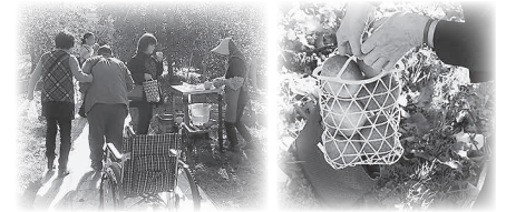
▲障がい児・者交流リンゴ狩りの様子

広報活動のために 139,050円 (6,250部) 社協だより(第78号分)を、全戸配布しました。