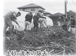
土砂・流木の除去