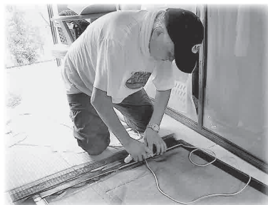
▲ささえあいサービス