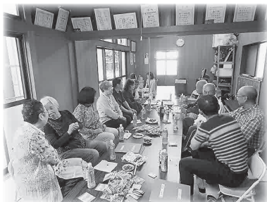
▲ふれあい・いきいきサロン