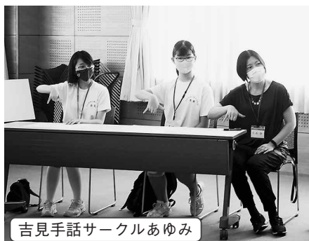
吉見手話サークルあゆみ