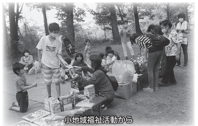
小地域福祉活動から