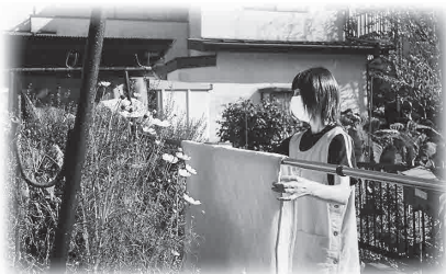
ヘルパーさんの 活動の様子

20年以上社協のホームヘルプサービスを利用させていただいています。皆さんいい方ばかりで助かっています。普段の何気ない会話が何より生きがいとなっています。皆さんの力を借りながら、今の生活が続けられ、1日も長く自宅で過ごしたいと思えます。