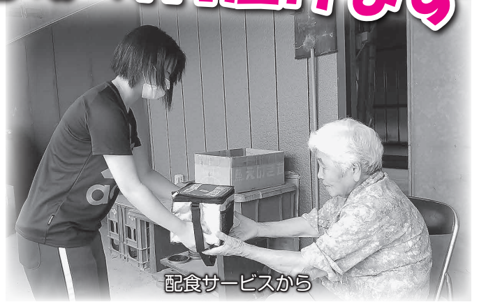
配食サービスから