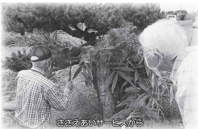
ささえあいサービスから