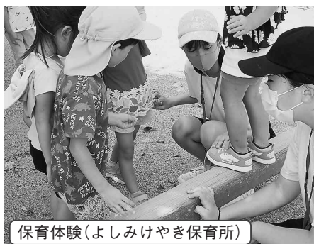
保育体験(よしみけやき保育所)