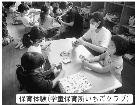
保育体験(学童保育所いちごクラブ)