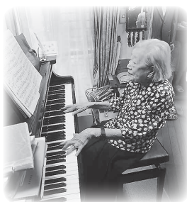
小高様、若い頃はピアノの先生でした。