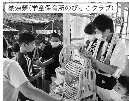
納涼祭(学童保育所のびこクラブ)