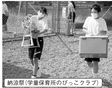
納涼祭(学童保育所のびこクラブ)