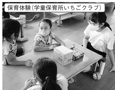
保育体験(学童保育所いちごクラブ)