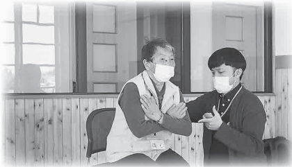
理学療法士の指導のもとに行う定期的な体力測定

社協では、吉見町から委託を受けて、吉見町介護予防施設「悠友館」で介護予防事業「げんきまもり隊」を実施しています。高齢者の心身機能や生活機能の向上を図ることを目的として、悠友館に通っていただき、6か月間、運動・栄養・口腔のプログラムを保健・医療・福祉の専門職が提供しています。