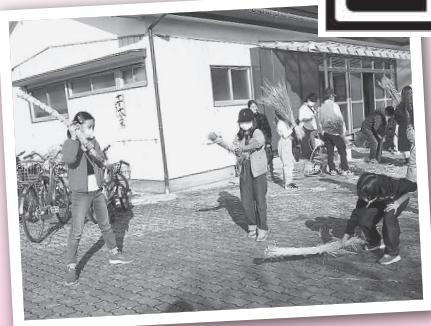
十日夜(とうかんや)祭り【一ツ木地区より】