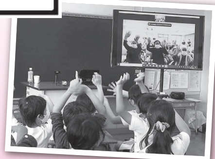
介護施設(常磐苑)とオンライン交流