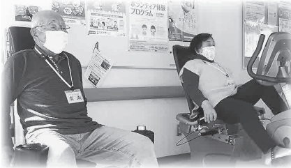
悠友館の設備を使って体を動かす運動訓練