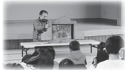
▲自作の紙芝居を作成し披露

冬休み期間中の学童クラブ（いちごクラブ）（のびっこクラブ）へ、読み聞かせボランティアを派遣しました。児童達は、語り手の話に食い入るように耳を傾けていました。