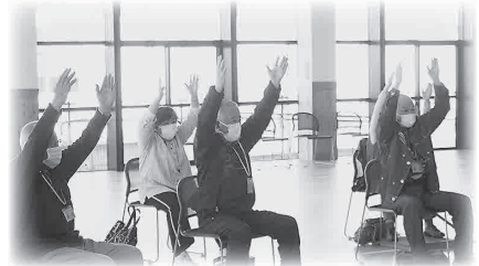
全身を使う歩行運動やストレッチで体を伸ばす運動訓練